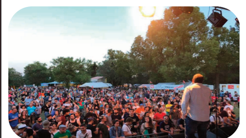
Fête à Lézan dans le Gard