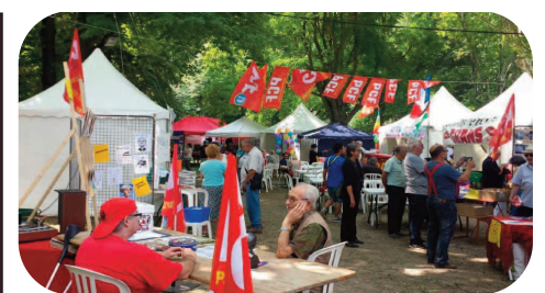
Fête du PCF Bouches-du-Rhône